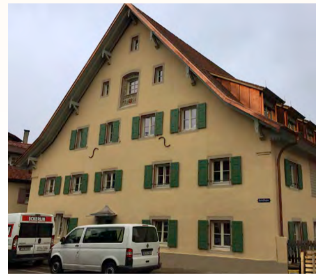
1581 erbaut, 2017 saniert: das denkmalgeschützte Spital in Staufen.

dividuell nach Bedarf und Absprache gewählt werden – täglich oder nur an einzelnen Werktagen. Zum Kennenlernen laden wir zu einem kostenfreien Schnuppertag ein.