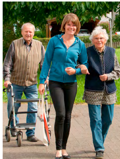
Im Alter so wichtig: Lebensqualität im Alltag und gesellschaftliche Teilhabe.

Wenn die Kommunen jetzt darangehen, die sozialen Lebensräume in den Gemeinden attraktiver zu machen, eröffnen sich Chancen, das Zusammenleben der Generationen und das Leben im Alter neu zu organisieren. Um dem steigenden Bedarf an Pflege und Unterstützung gerecht zu werden, arbeiten Kirchliche Sozialstationen seit jeher eng mit den Kommunen zusammen.