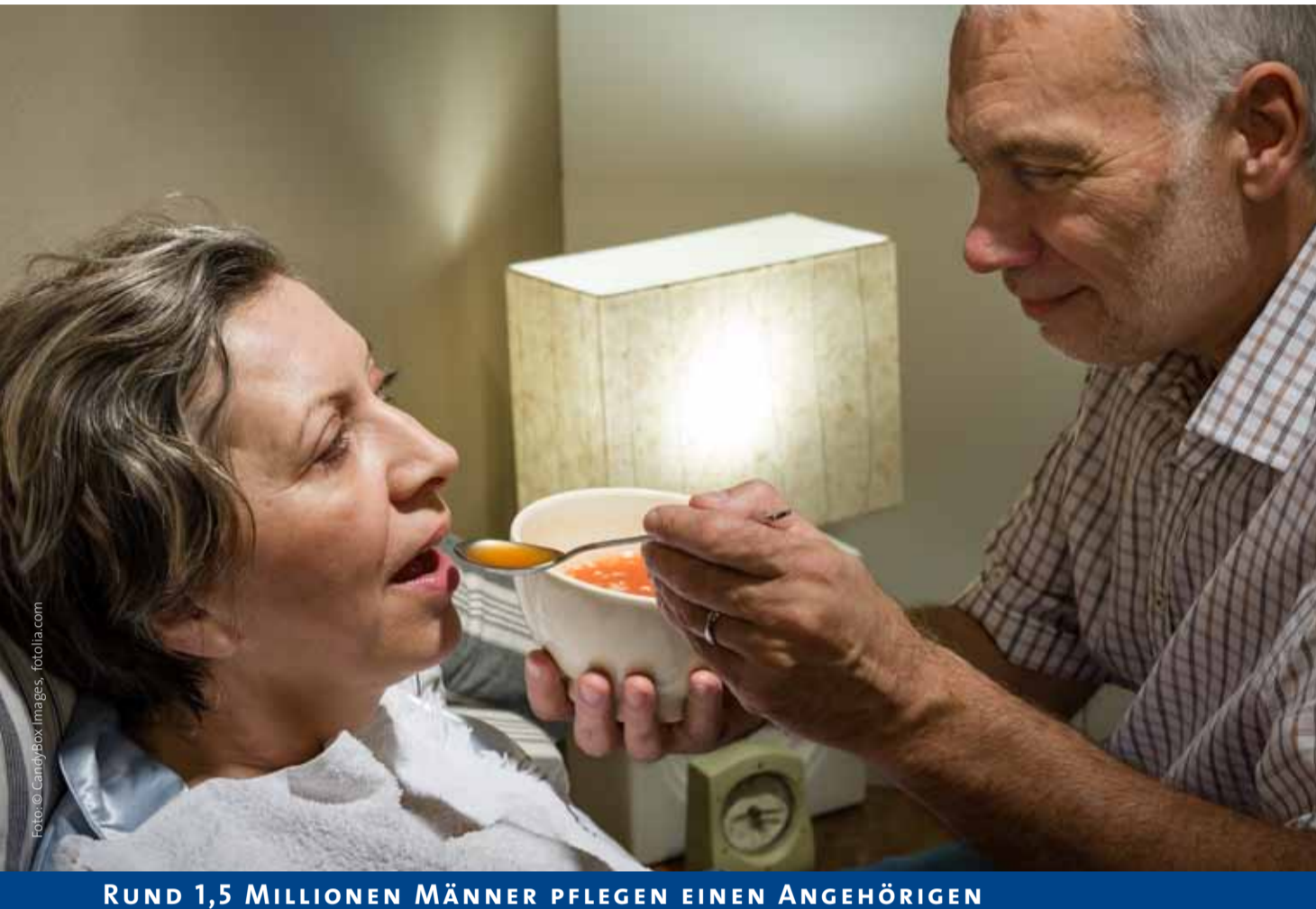
Der Pflegealltag ist für Männer oft nicht einfach, obwohl sie meist mehr Anerkennung bekommen als Frauen.

RUND 1,5 MILLIONEN MÄNNER PFLEGEN EINEN ANGEHÖRIGEN