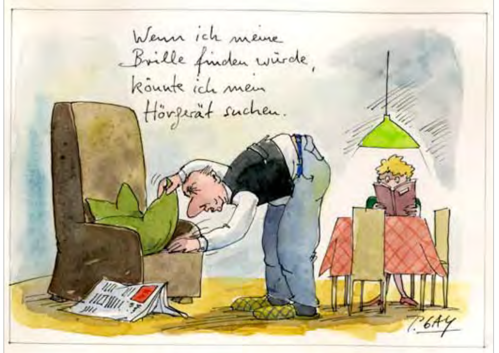
© www.gaymann.de sowie aus dem Buch Wellness, erschienen bei Mosaik/Goldmann.