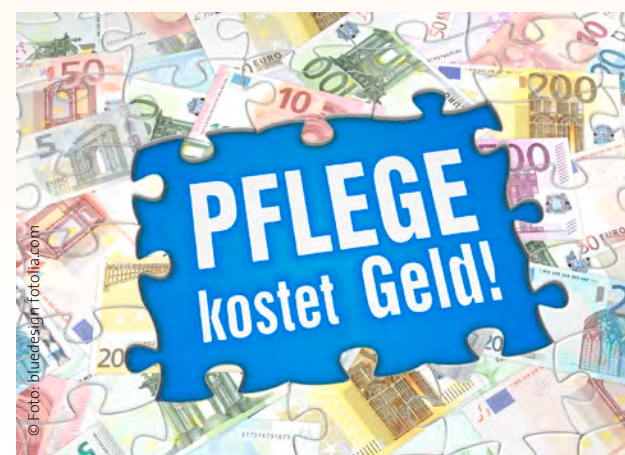
Pflege ist wert-voll.

Mitarbeitenden. In den letzten Jahren wurde die Differenz von Tariflöhnen zu den Leistungsentgelten der Kran-