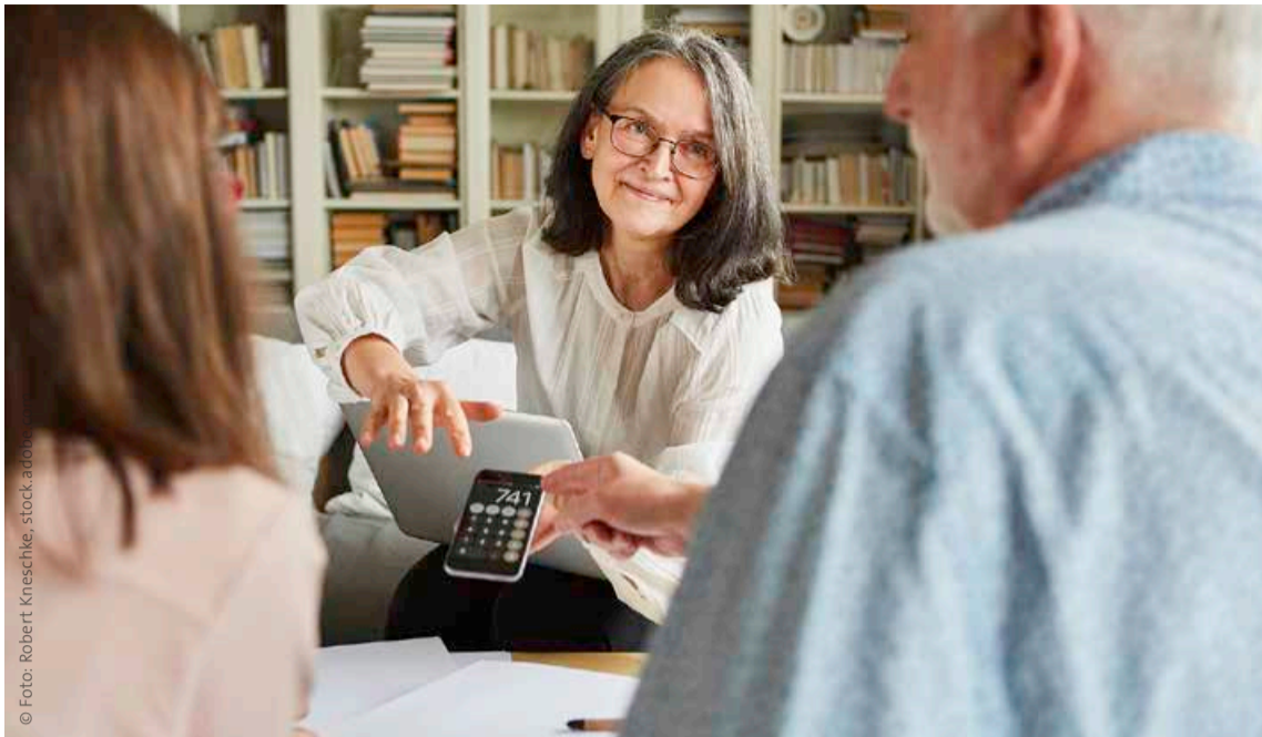
Kolleginnen und Kollegen, der Personalrat oder Vereinbarkeitsberaterinnen bzw. -berater können helfen, die Situation am Arbeitsplatz zu gestalten.