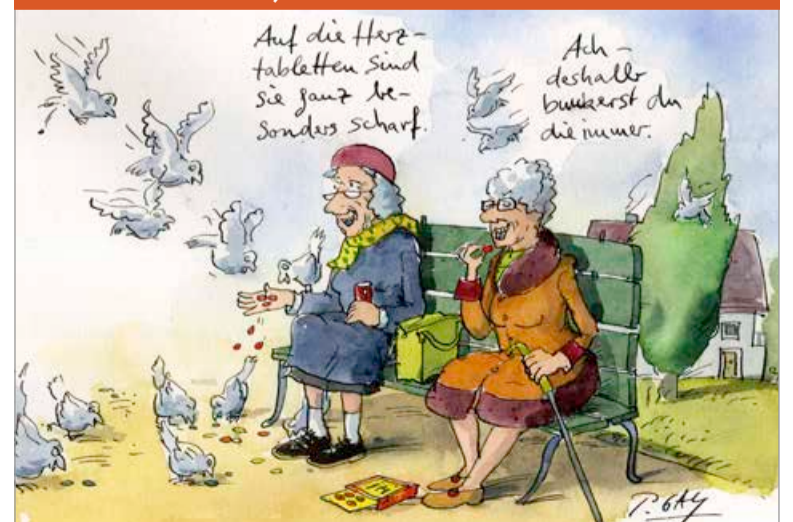
© Peter Gaymann, www.demensch.gaymann.de Die Zeichnung stammt aus dem DEMENSCH-Kalender.